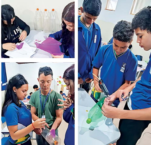
Figura 4 – Os estudantes construindo os foguetes