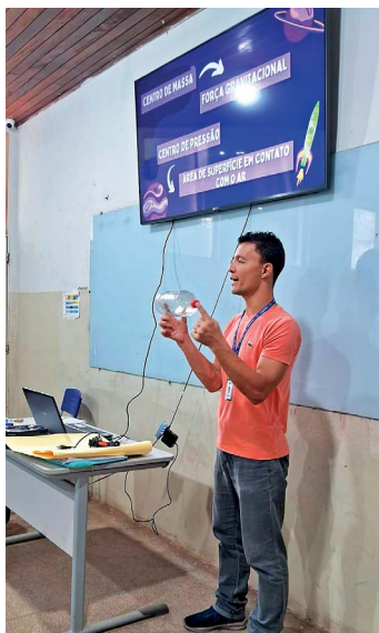
Figura 3 – Minicurso sobre as regras da competição de foguetes e apresentação dos princípios físicos envolvidos.

Foram realizadas análises detalhadas com os estudantes para investigar os fatores que podem proporcionar maior alcance nos lançamentos dos foguetes. Para isso, apresentamos conceitos físicos fundamentais, como centro de massa, centro de pressão, aerodinâmica e força gravitacional. Esses conceitos foram explorados em profundidade para mostrar suas relações com a estrutura do foguete e sua performance aerodinâmica. Através de discussões e experimentos práticos, os alunos puderam entender como cada um desses fatores influencia o voo do foguete, permitindo-lhes aplicar esse conhecimento para otimizar seus designs e melhorar os resultados dos lançamentos.