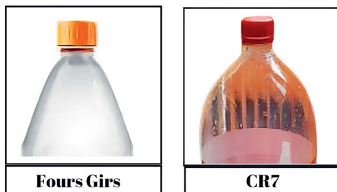
Figura 7 – Comparação dos bicos dos foguetes

O foguete da Nasa ficou em 2º lugar, analisando a sua estrutura, percebeu-se que esse grupo utilizou uma garrafa de 2 litros para fazer a construção e que o bico tinha um formato mais curvo, menos aerodinâmico quando comparado ao foguete Fours Girls.