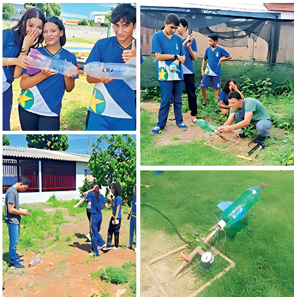
Figura 6 – Lançamentos dos foguetes

Os lançamentos dos foguetes foram realizados na quadra da escola, sob a supervisão do membro do MT Ciências e da professora dos alunos. A base para realização dos lançamentos foi construída pelo MT Ciências, baseada nos modelos sugeridos pela MOBFOG, em seu site.