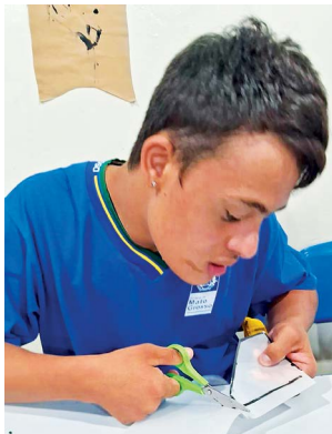
Figura 5 – Aluno da educação especial construindo o foguete

Os estudos realizados no minicurso possibilitaram a confecção do foguete pelos alunos. Os materiais utilizados foram: três garrafas PETs, massinha de modelar, plásticos, cola quente. Para a construção do foguete, os alunos encontraram o centro de pressão, equilibrando a garrafa PET. Apesar desse método não ser 100% preciso, eles puderam fazer essa demarcação. Os alunos escolheram também o material das aletas e o formato para o foguete. A atividade proporcionou a inclusão de um dos alunos da turma, que pertence ao público da educação especial, e que fez também a confecção do seu foguete.