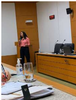
Figura 7 – Palestra para Cores 2022