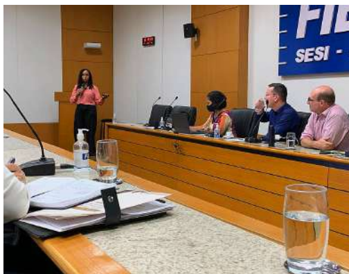
Figura 8 – Fórum Nacional de Desfazimento – Descarte órgãos públicos